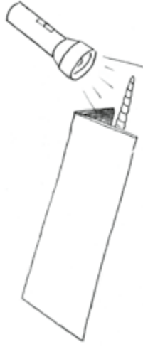
Illustration: U. Suckow

Falte aus einem Stück Pappe ein Dach und stelle es über einen Regenwurm. Leuchte mit einer Taschenlampe langsam nacheinander auf je ein Ende des Regenwurms. Wie verhält sich der Regenwurm?